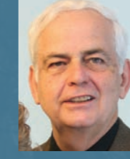
Missionnaire en Europe, Équipe des Ressources Assemblies of God World Missions

« Ma plus grande vision pour le CTS est que des hommes et des femmes puissent y recevoir un solide fondement biblique et être ensuite envoyés pour exercer un ministère efficace par la puissance et sous l'onction du Saint-Esprit. »